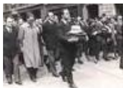
una foto del funerale

Per conto del "SIM" ( Servizio di Spionaggio Militare italiano ) il 9 giugno 1937 Carlo e Nello Rosselli vengono assassinati, per volontà di BENITO MUSSOLINI e di GALEAZZO CIANO, nei pressi della stazione termale di Bagnoles De l'Orne in Normandia, pugnalati dai fascisti francesi appartenenti all'associazione terroristica "La Cagoule", che in cambio ottenne armi.